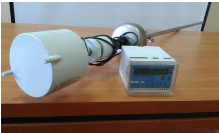
Рисунок 1 – Общий вид уровнемеров У1500М-DIN