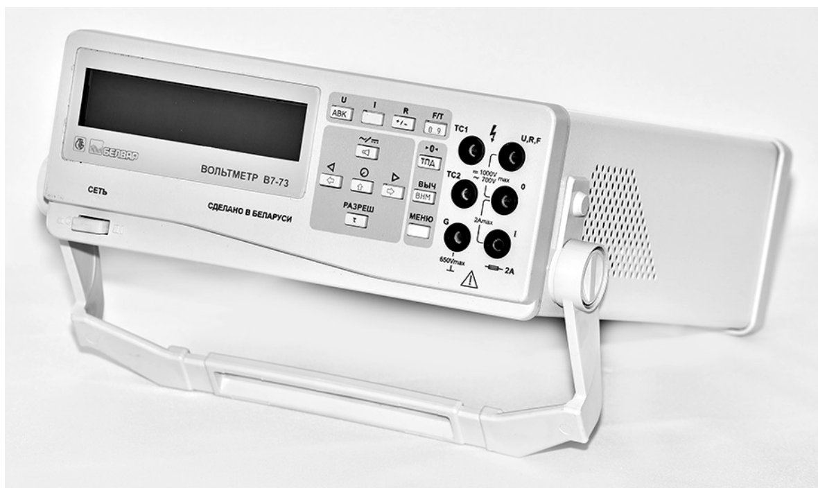
Рисунок 1 – Общий вид вольтметра В7-73

Вольтметр опломбирован на задней панели в одном из отверстий крепежных винтов. Общий вид вольтметра приведен на рисунке 1.