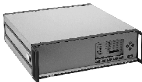
Модели MLT3, MLT4