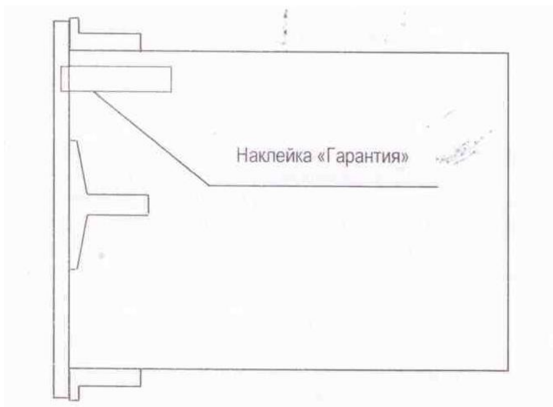
Рисунок 3 – Схема пломбировки от несанкционированного доступа