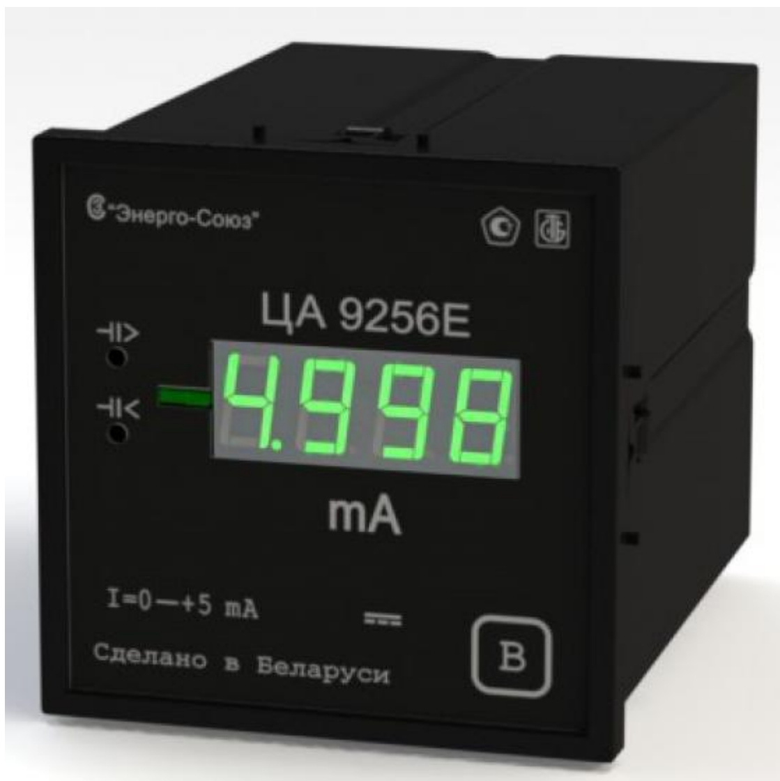
Рисунок 1 – Фотография общего вида прибора ЦА 9256