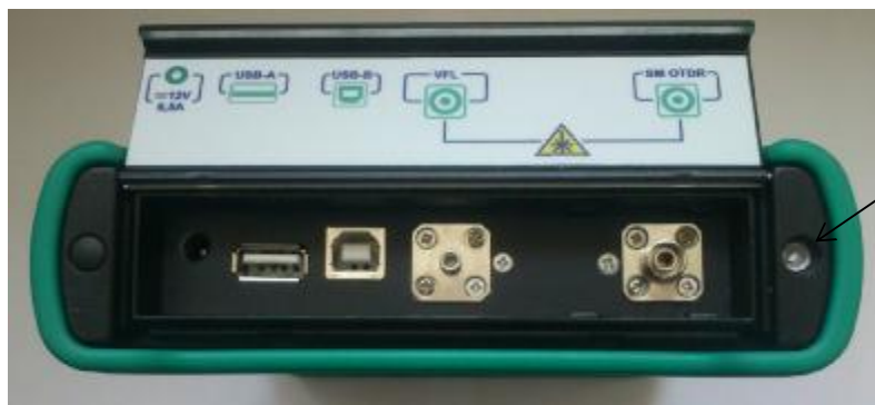
Рисунок 2- Прибор оптический измерительный многофункциональный МТР 6000- Вид сзади