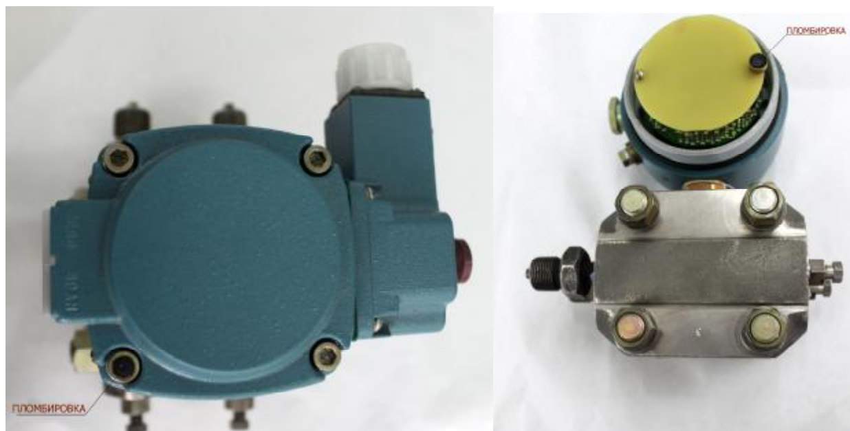
Рисунок 2 – Места пломбировки преобразователей измерительных Сафир-22М, Сафир-22МТ, Сафир-22-Ех-М