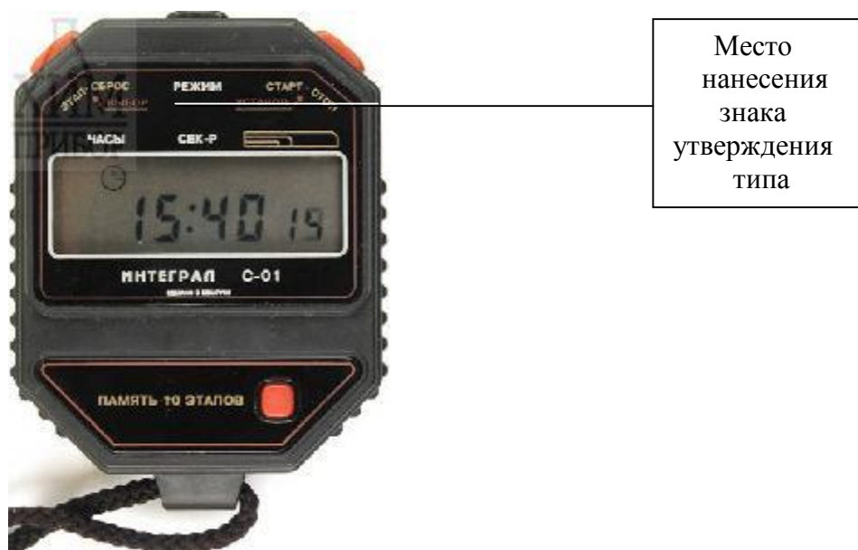
Рисунок 1 - Внешний вид секундомеров и место нанесения знака утверждения типа

Внешний вид секундомеров приведен на рисунке 1.