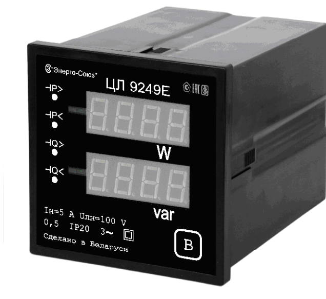
Рисунок 2 – Общий вид преобразователя модификации Е