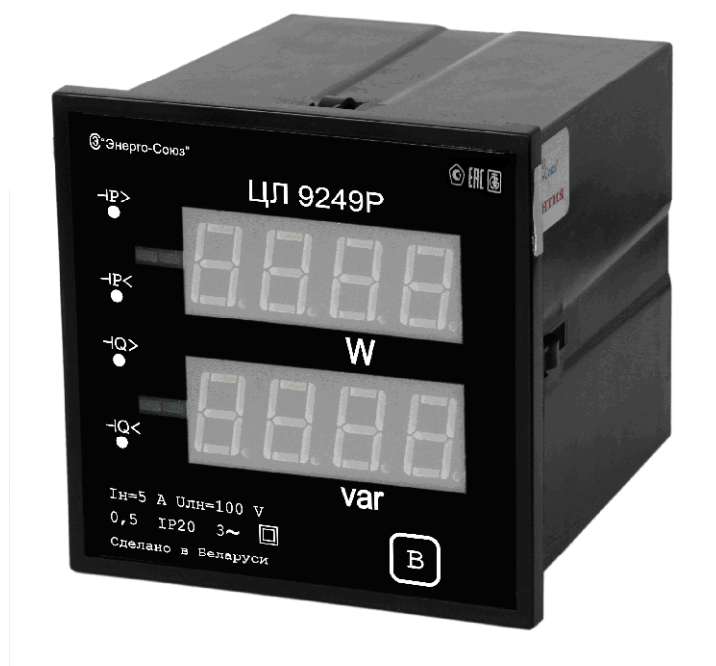
Рисунок 1 – Общий вид преобразователя модификации Р