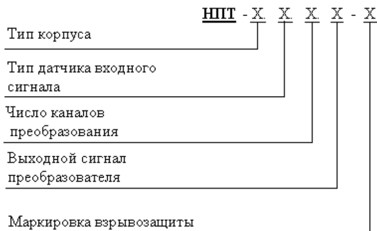
Рисунок 1 - Структура условного обозначения преобразователей

Информация о возможных исполнениях преобразователей приведена в структуре условного обозначения, представленного на рисунке 1.