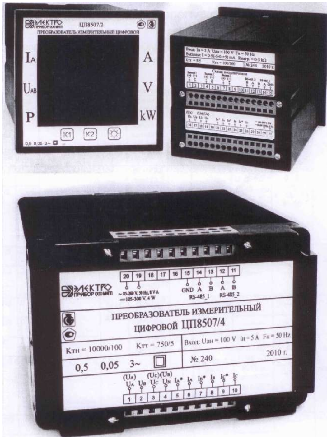
Рисунок 1 - Фотографии общего вида ЦП

Схема пломбировки от несанкционированного доступа и указание мест нанесения оттисков клейма ОТК и клейма знака поверки средств измерений для модификаций ЦП8507/3 - ЦП8507/6, ЦП8507/9 - ЦП8507/12 приведена на рисунке 3.