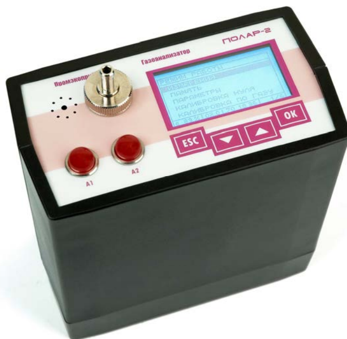
Рисунок 1 – Внешний вид газоанализаторов «Поляр-2»

Вид взрывозащиты – «искробезопасная электрическая цепь i» по ГОСТ Р 52350.11-2005 (МЭК 60079-11:2006) и «взрывонепроницаемая оболочка d» по ГОСТ Р 52350.1-2005 (МЭК 60079-1:2003).