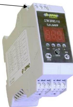
Рис. 2 Система газоаналитическая многофункциональная СГМ ЭРИС-110 (DIN-рейка)