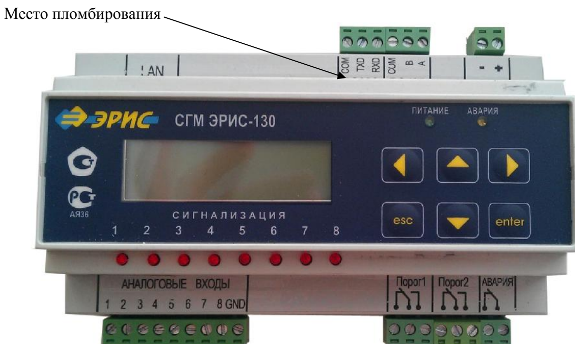
Рис. 4 Система газоаналитическая многофункциональная СГМ ЭРИС-130 (DIN-рейка)