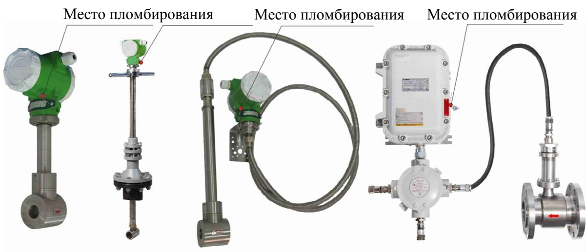
Рисунок 5 - Схема пломбирования от несанкционированного доступа, обозначение места нанесения знака поверки преобразователей расхода вихревых "ЭМИС-ВИХРЬ 200 (ЭВ-200)"

Схема пломбирования от несанкционированного доступа, обозначение места нанесения знака поверки представлены на рисунке 5.