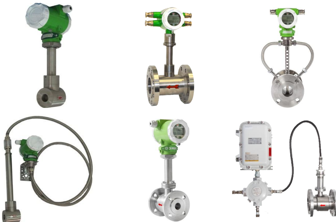
Рисунок 1 - Общий вид преобразователей расхода вихревых "ЭМИС-ВИХРЬ 200 (ЭВ-200)" модификации ЭВ-200

Общий вид преобразователей расхода "ЭМИС-ВИХРЬ 200 (ЭВ-200)" модификации ЭВ-200 приведен на рисунке 1, модификации ЭВ-200-ППД - на рисунке 2, модификации ЭВ-205 - на рисунке 3, модели ЭВ-200-СКВ - на рисунке 4.