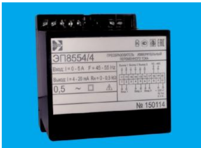
Рисунок 1 – Общий вид средства измерений ЭП8554/1 - ЭП8554/6

Схема пломбировки от несанкционированного доступа обозначение места нанесения знака поверки представлены на рисунках 3 и 4.