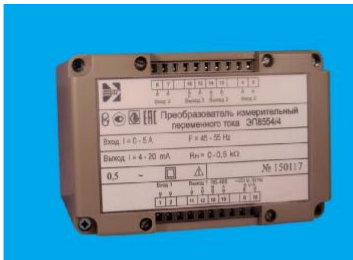
Рисунок 2 – Общий вид средства измерений ЭП8554/3, ЭП8554/4