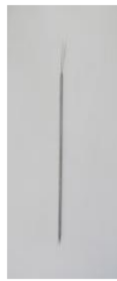
Вставка термо- метрическая для ТМТ-12