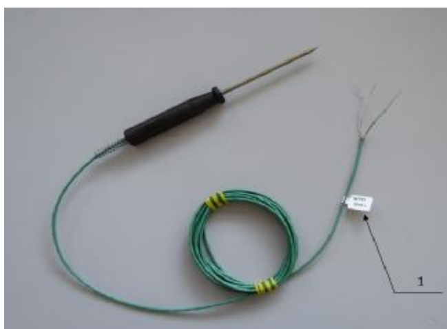
Рисунок 1 – Внешний вид термометра медного технического ТМТ-7-3. (1 – место нанесения маркировки)

Термометры модификации ТМТ-7 состоят из монтажной части, выполненной из стальной трубки (сталь 12Х18Н10Т), эбонитовой ручки и выводящего кабеля (МГТФЭФ, МГТФЭС). Способ контакта с измеряемой средой – погружаемый.