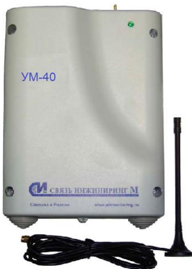
Рисунок 1 – Внешний вид устройства мониторинга «УМ-40»

Внешний вид устройства приведен на рисунке 1, место пломбировки устройства приведено на рисунке 2.