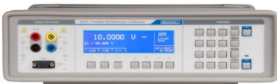
Рисунок 3 – Фотография передней панели CALIBRO-143