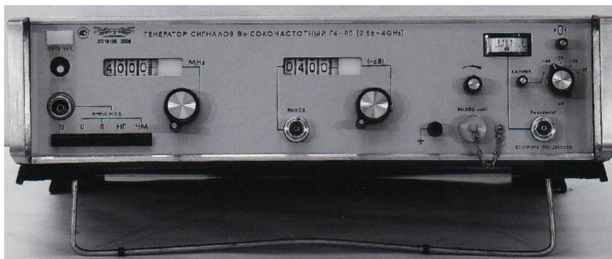
Рисунок 1 – Общий вид генератора сигналов высокочастотного Г4-80