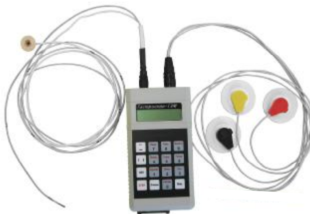
Рис. 1. Общий вид гастроэнтеромонитора