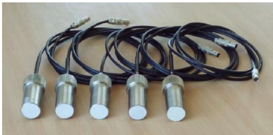
Рисунок 2 – Общий вид ПЭП