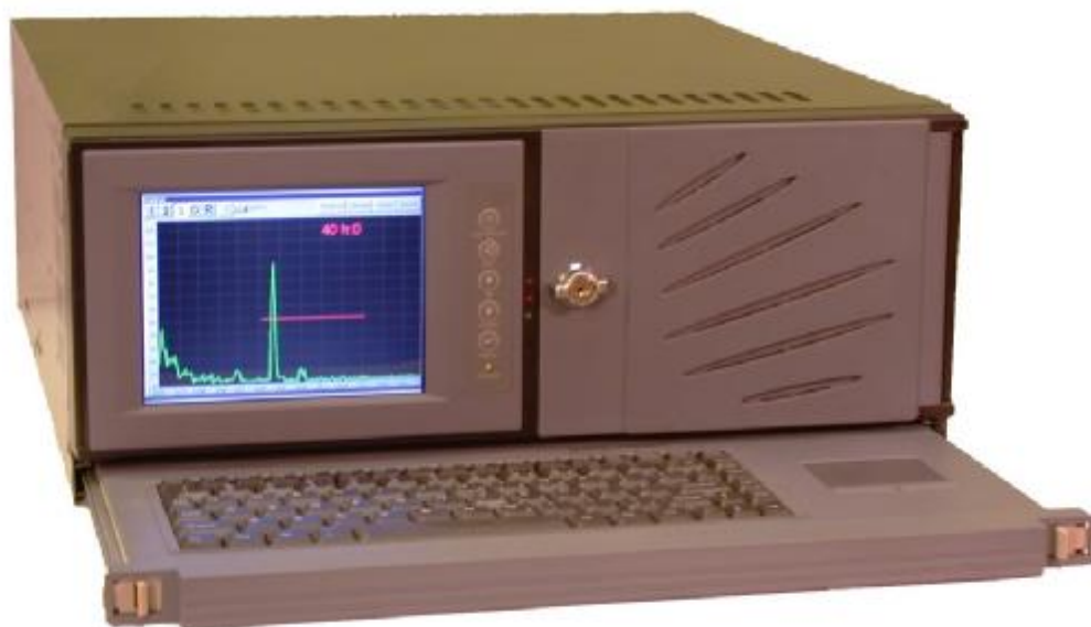
Рисунок 1 – Общий вид дефектоскопов