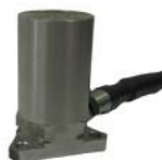
Рисунок 4 – Преобразователи модели ТМК-121-х Внешний вид преобразователей модели ТМК-161-х приведен на рисунке 5.