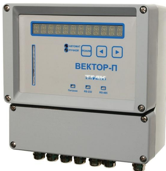
Рисунок 2 – Анализаторы параметров вибрации и механических величин многоканальные «Вектор-П»

Внешний вид анализаторов параметров вибрации и механических величин многоканальных «Вектор-П» приведен на рисунке 2.