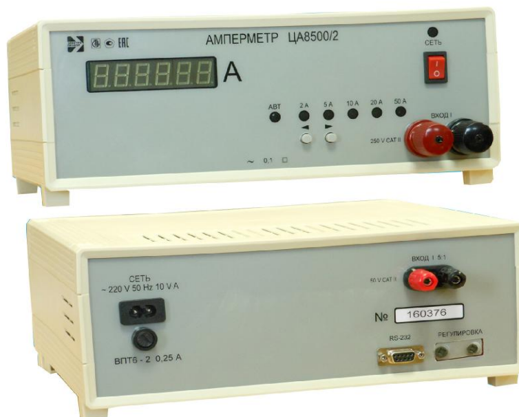
Рисунок 1 - Общий вид модификаций амперметров ЦА8500/1, ЦА8500/2