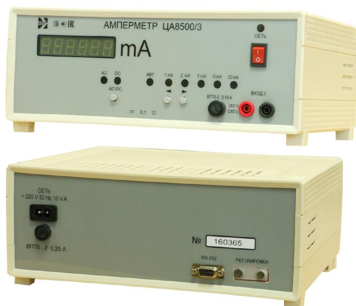
Рисунок 2 - Общий вид модификаций амперметров ЦА8500/3 - ЦА8500/6