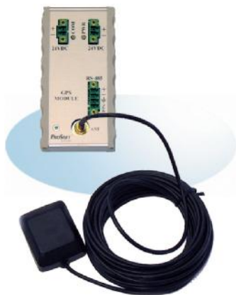
Рисунок 7 - Внешний вид GPS MODULE

Для обеспечения бесперебойного питания модулей в состав УТМ «ЭКОМ-ТМ» входит источник бесперебойного питания UPS 50W.