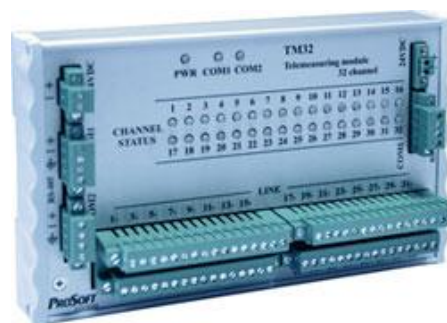
Рисунок 4 - Внешний вид ТМ-32