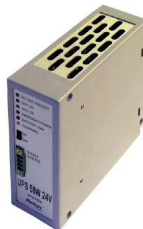
Рисунок 8 - Внешний вид UPS50W

Управляющие модули и модули расширения содержат встроенный сторожевой таймер, перезапускающий модули в случае остановки работы встроенного ПО. Управляющие модули имеют встроенный Web-сервер.