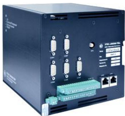
Рисунок 1 - Внешний вид модуля ММТ-2.1 (внешних различий у модификаций ММТ-2 нет)