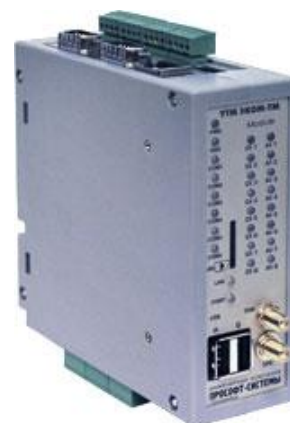
Рисунок 2 - Внешний вид ММТ-5