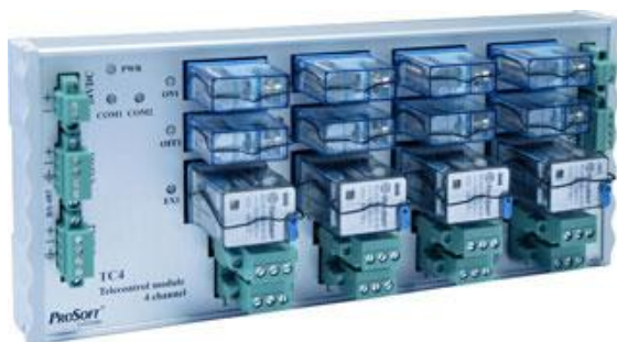
Рисунок 5 - Внешний вид ТС-4