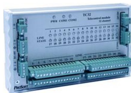
Рисунок 6 - Внешний вид ТС-32