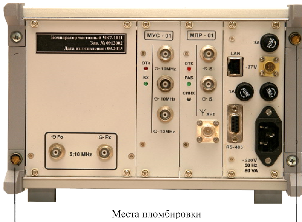
Рисунок 2 – Схема пломбировки от несанкционированного доступа.

Схема пломбировки компараторов от несанкционированного доступа приведена на рисунке 2.