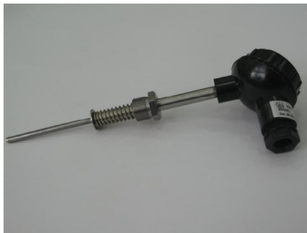
Рис.2 – ТП модификации ТНН/ТЖК-104