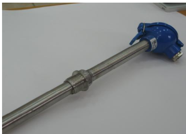
Рис.1 - ТП модификации ТНН/ТЖК-202

Фотографии общего вида ТП приведены на рисунках 1-4: