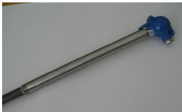
Рис.3 – ТП модификации ТНН/ТЖК-232