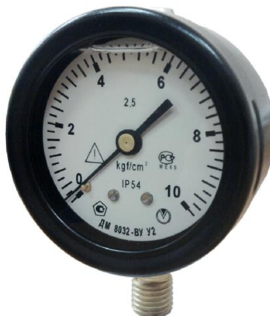
Рисунок 1 - Общий вид прибора

Фотография общего вида прибора приведена на рисунке 1.