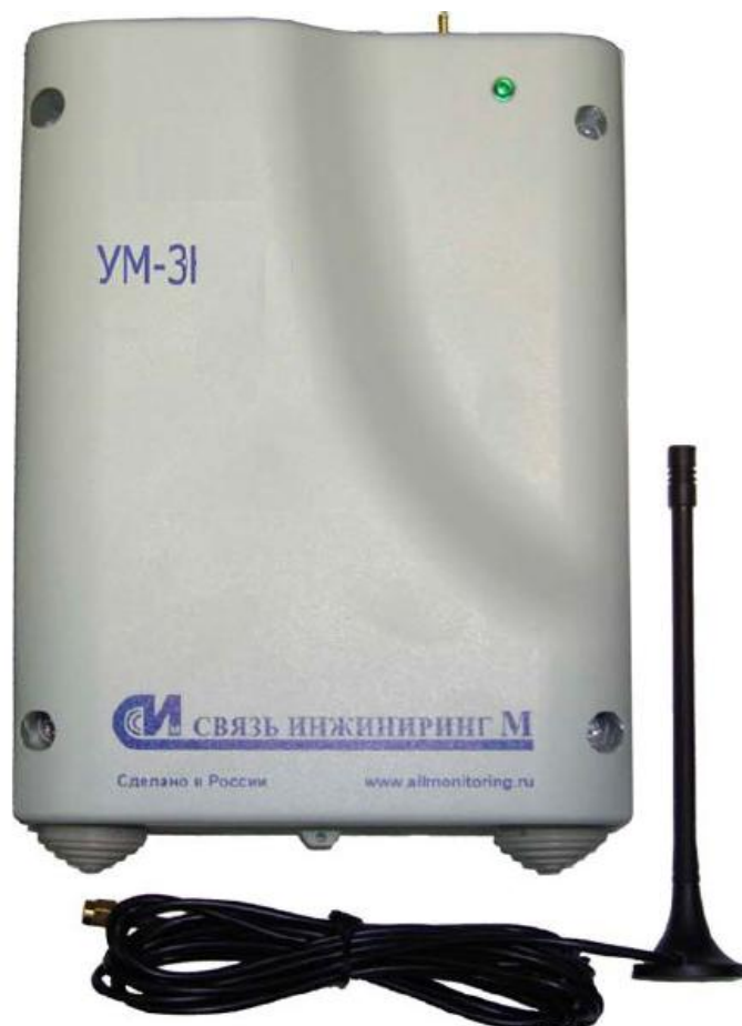
Рисунок 1 - Внешний вид устройств мониторинга «УМ-31»