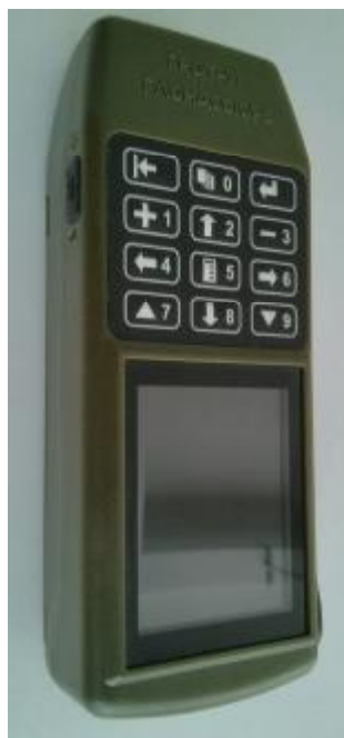
Рисунок 1 - Внешний вид аппаратуры

Место нанесения наклейки «Знак утверждения типа» и схема пломбировки аппаратуры от несанкционированного доступа приведена на рисунке 2.