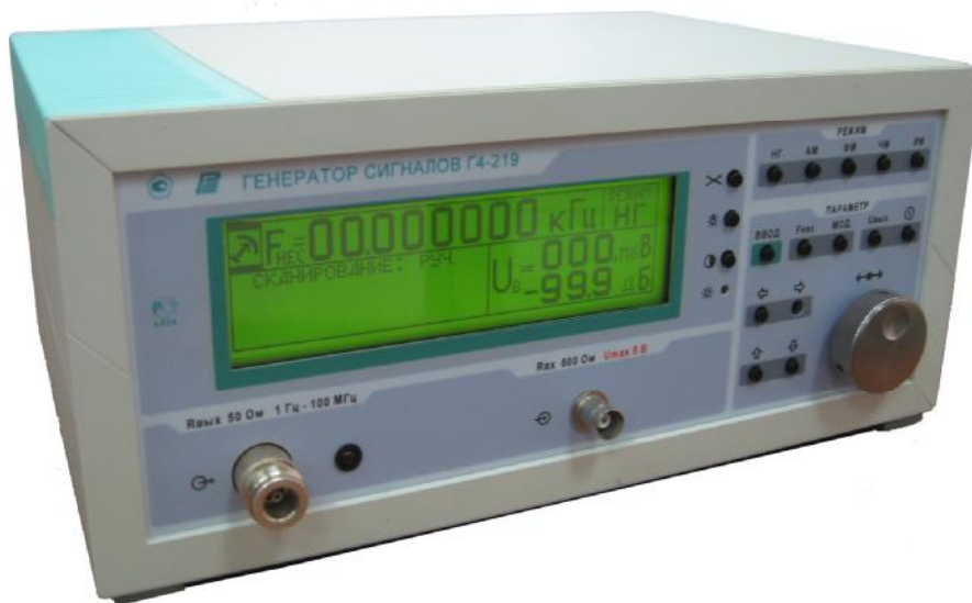
Рисунок 1 - Общий вид генератора