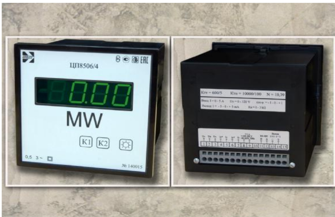
Рисунок 1 – Фотография общего вида устройств ЦП8506/1 – ЦП8506/8 ЦП8506/17 – ЦП8506/24 с габаритными размерами 120 x 120 x 130 мм

Схема указания мест пломбировки от несанкционированного доступа и места расположения наклеек приведены на рисунке 4.