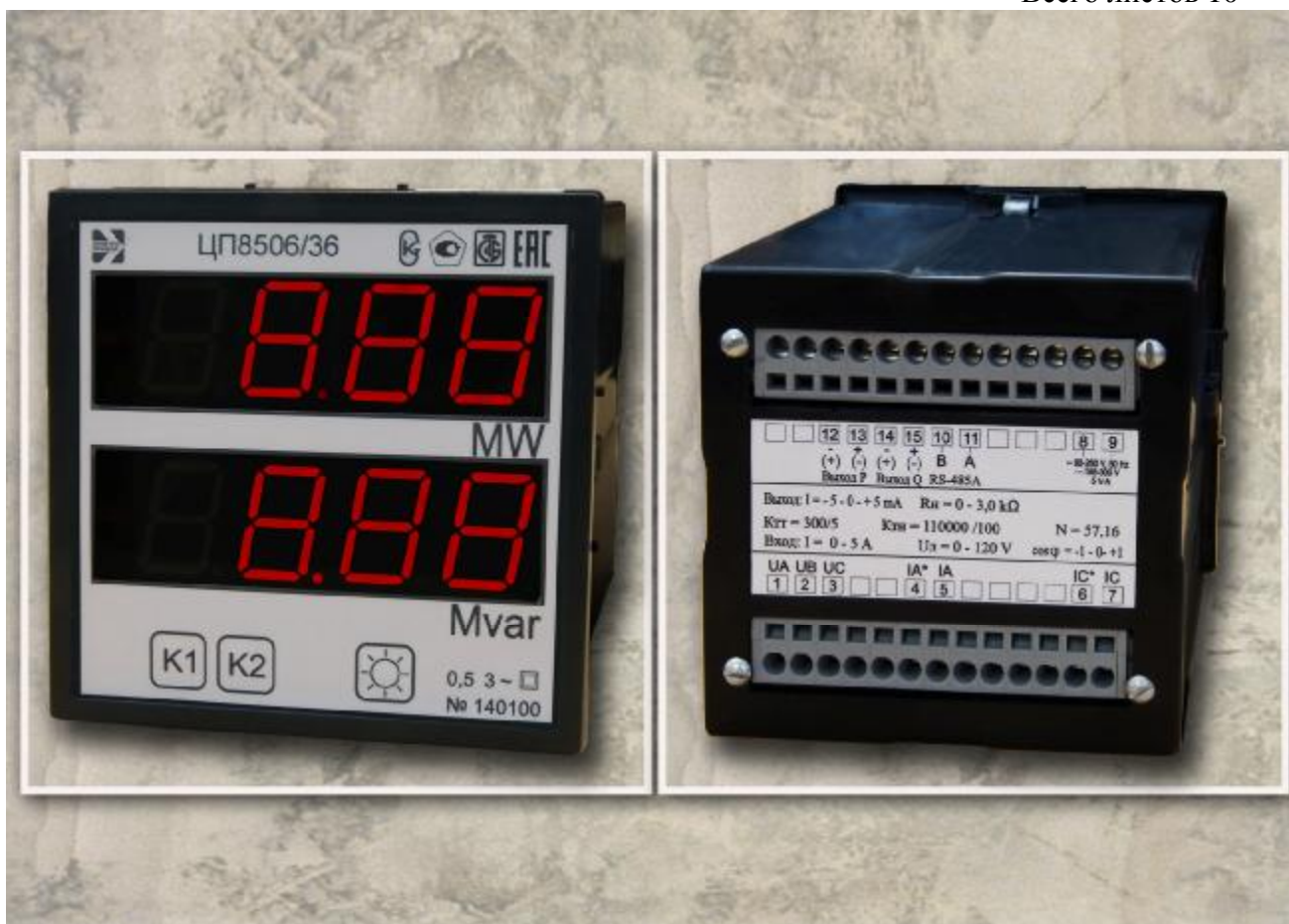
Рисунок 3 – Фотография общего вида устройств ЦП8506/33 – ЦП8506/40 с габаритными размерами 96 x 96 x 130 мм