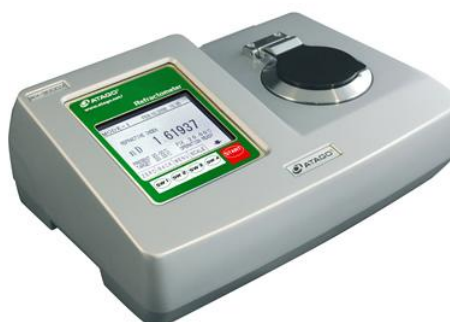
Рисунок 4 - Рефрактометр автоматический цифровой RX-9000alpha