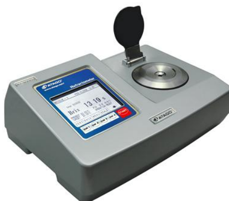
Рисунок 2 - Рефрактометр автоматический цифровой RX-5000alpha