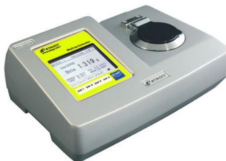
Рисунок 1 - Рефрактометр автоматический цифровой RX-007alpha.

Рефрактометр автоматический цифровой RX-5000alpha-bev отличается от RX-007alpha, RX-5000alpha и RX-9000alpha только конструкцией воронки для размещения образца, которая облегчает чистку воронки после измерения.