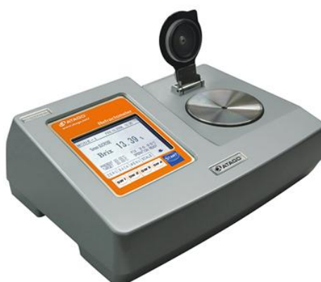
Рисунок 3 - Рефрактометр автоматический цифровой RX-5000alpha-bev.