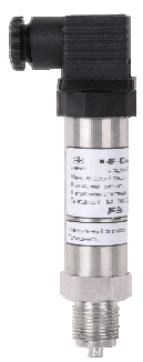
АИР-10/М1, АИР-10/М2 АИР-10Н, АИР-10І