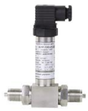
АИР-10/М1, АИР-10/М2 АИР-10Н, АИР-10L