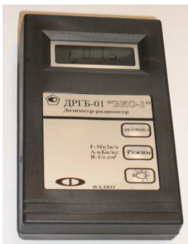
Рис. 1 – Общий вид дозиметра Программное обеспечение

Общий вид дозиметра приведен на рисунке 1. Схема опломбирования представлена на рисунке 2.