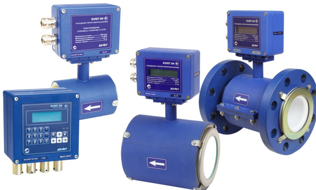
Рисунок 1 – Общий вид расходомеров-счетчиков электромагнитных «ВЗЛЕТ ЭМ»

Общий вид расходомеров-счетчиков электромагнитных «ВЗЛЕТ ЭМ» представлен на рисунке 1.