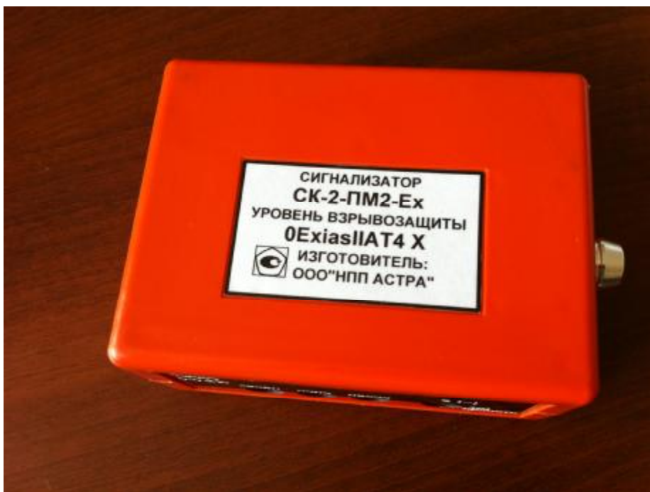
Рис.3 Фотографии общего вида переносных сигнализаторов СК-2

В сигнализаторах в качестве измерительных преобразователей применяют каталитические, электрохимические и оптические ИК (NDIR) сенсоры.