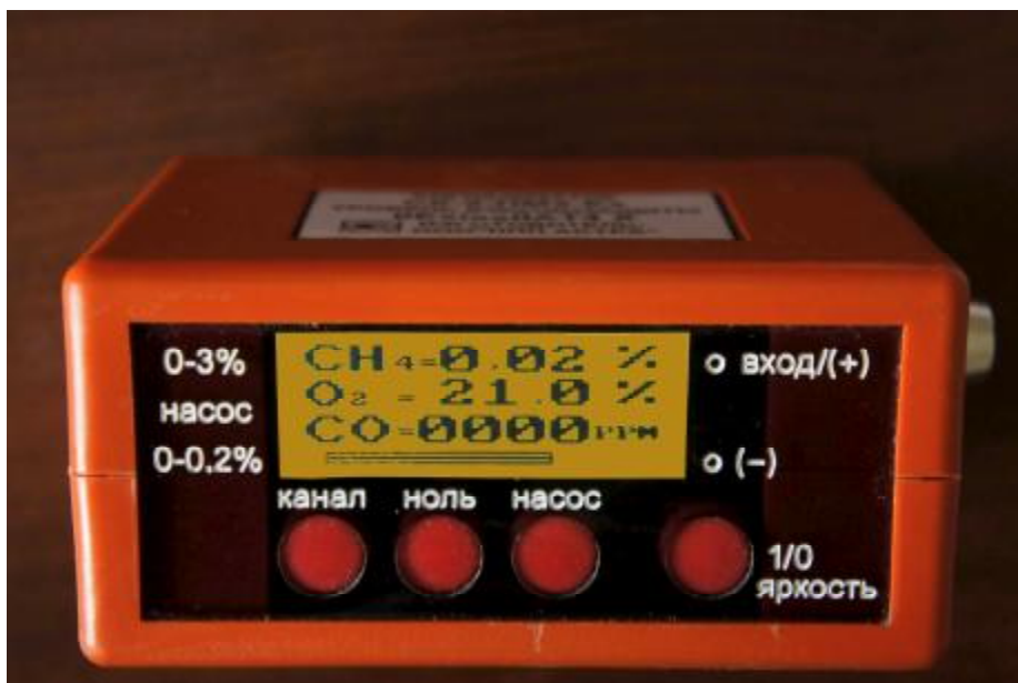
Рис.2 Фотографии общего вида переносных сигнализаторов СК-2