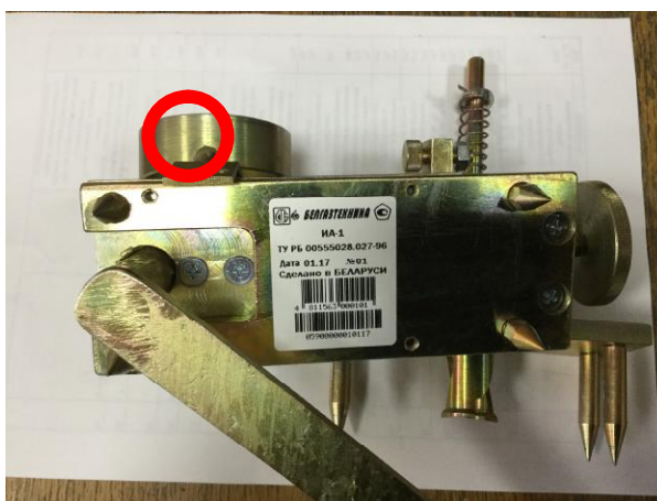
Рисунок 3 - Место нанесения знака поверки