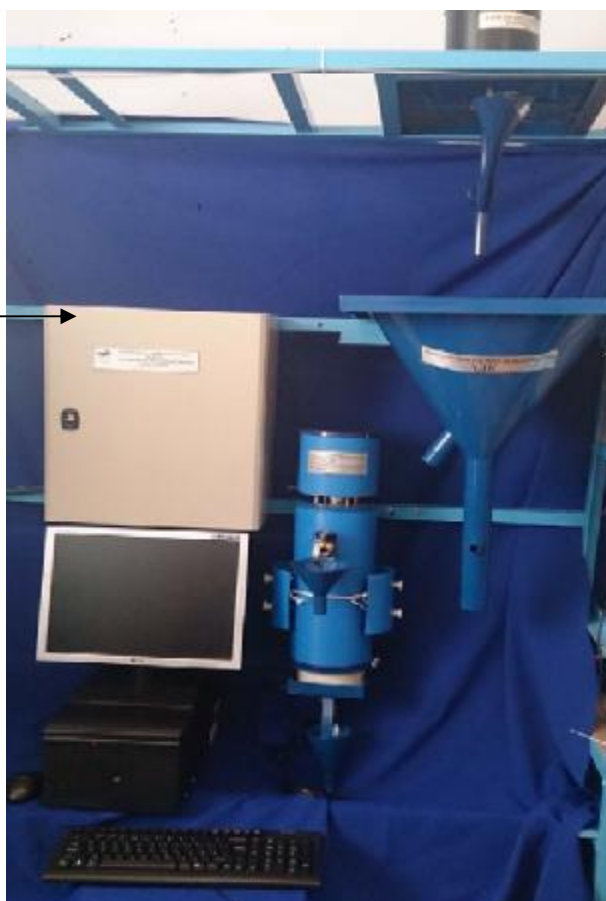
Рисунок 1 – Фото общего вида КИМ «АДК»