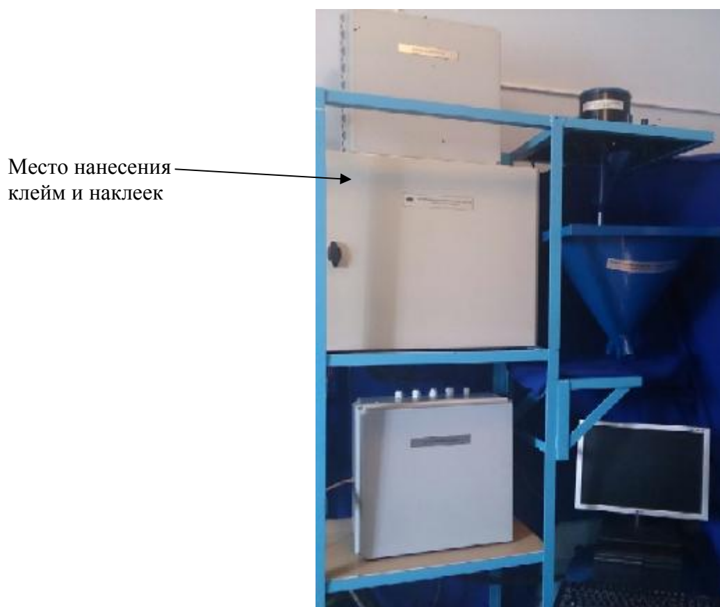
Рисунок 3 – Фото общего вида КИМ «Хлор-мониторинг»

Пломбирование блоков приводов (блок распределения потоков, блок стеклоочистки, блок очистки электродов), датчика кондуктометрического и рабочей емкости осуществляется на соединении крышек с корпусами в месте крепления винтов.