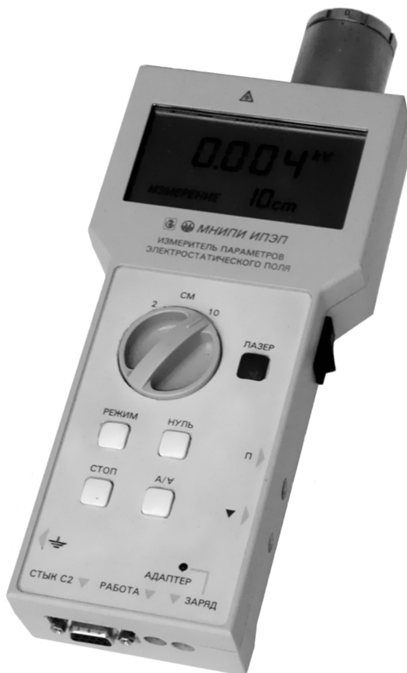
Рисунок 1 – Общий вид измерителя напряженности электростатического поля ИПЭП-1