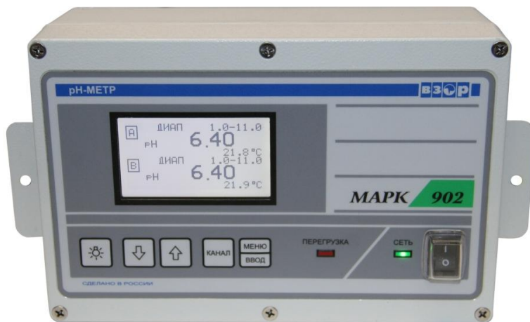
а - Общий вид

Схема пломбирования от несанкционированного доступа к элементам конструкции, обозначение места нанесения знака поверки представлены на рисунке 1б.