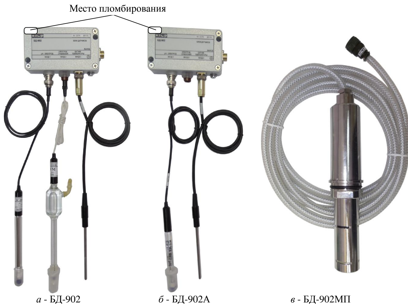
Рисунок 2 - Блок датчиков