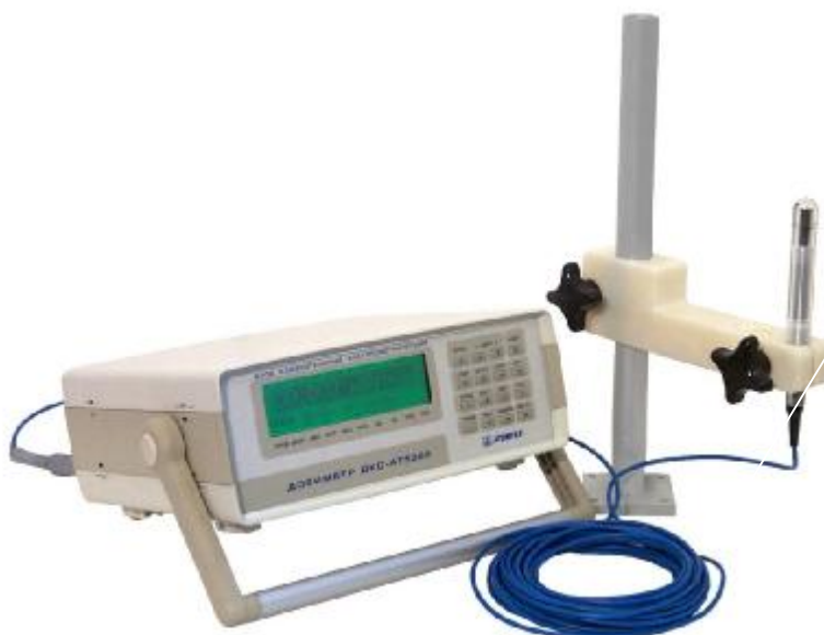
Рис. 1. Внешний вид дозиметров ДКС-АТ5350, ДКС-АТ5350/1

Внешний вид дозиметров представлен на рисунке 1, место пломбирования от несанкционированного доступа – на рисунке 2.