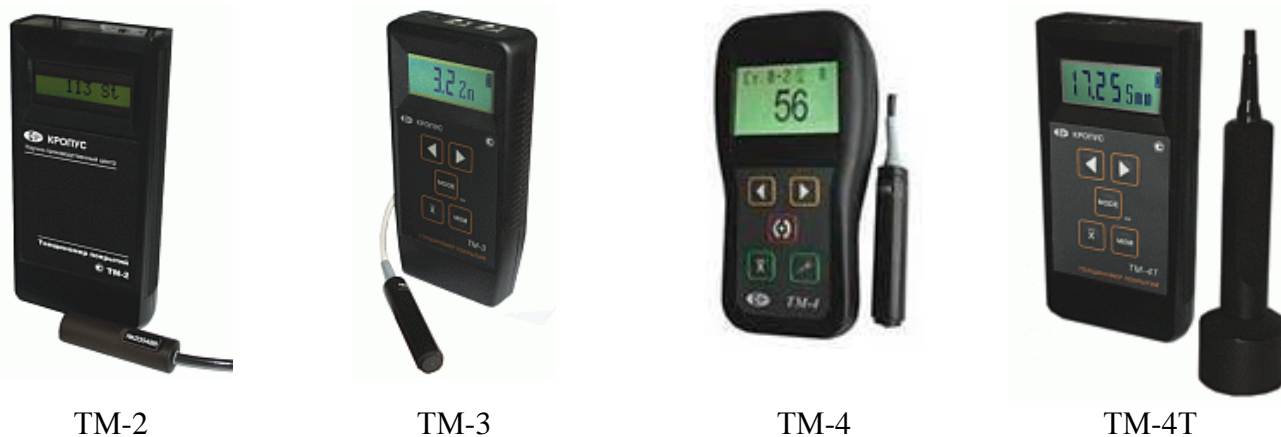
Рисунок 1 – Общий вид толщиномеров покрытий

Фотографии общего вида толщиномеров покрытий представлены на рисунке 1.