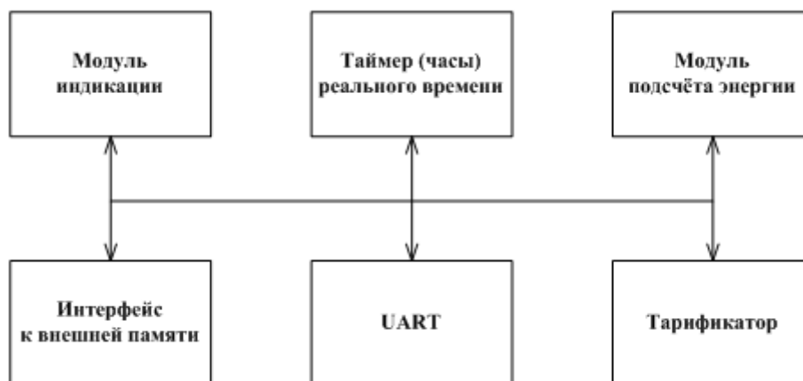
Рисунок 3 - Структура программного обеспечения «Меркурий 200»

Программное обеспечение состоит из следующих модулей: