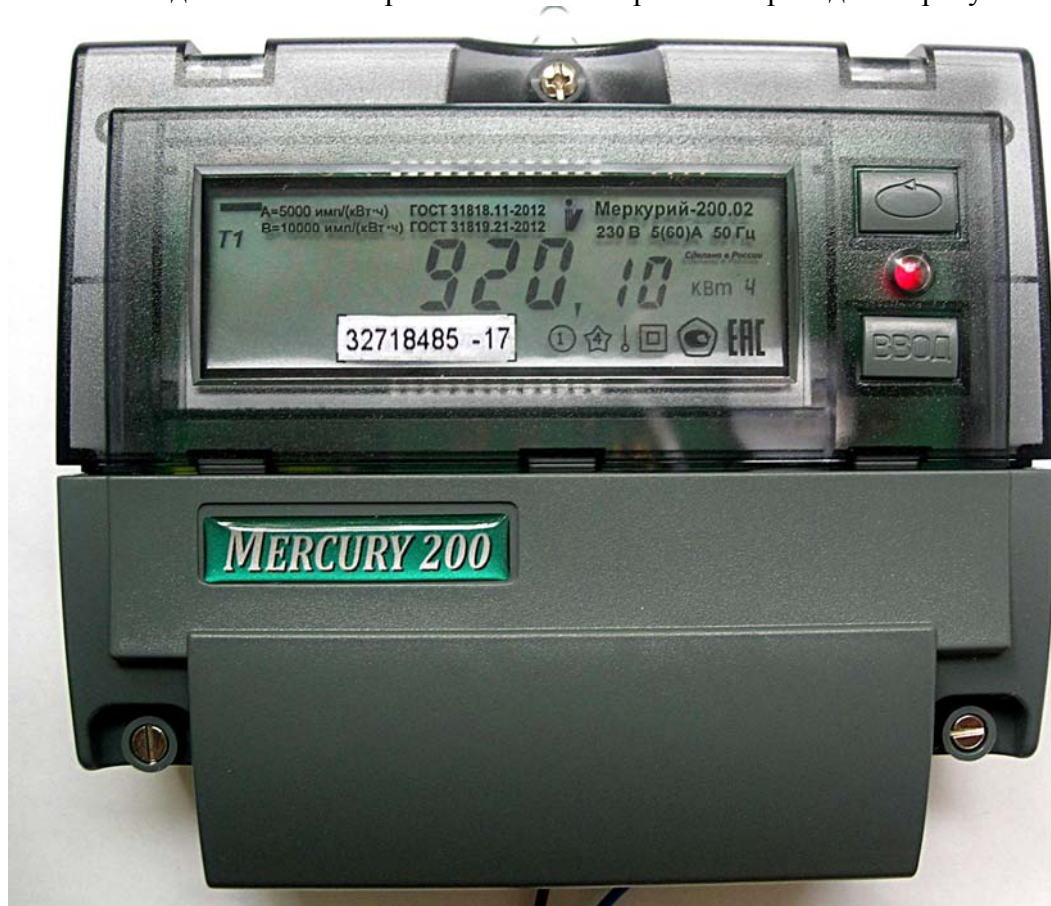
Рисунок 1 - Внешний вид счетчика с закрытой клеммной крышкой

Внешний вид счетчика с закрытой клеммной крышкой приведён на рисунке 1.