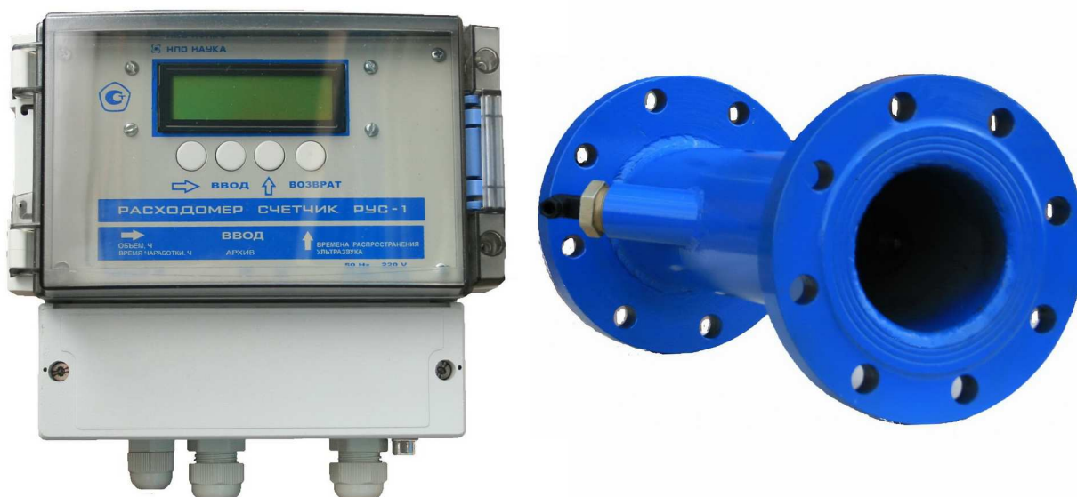
Рисунок 1 - Общий вид расходомеров-счетчиков ультразвуковых РУС-1

Общий вид приборов приведен на рисунке 1.