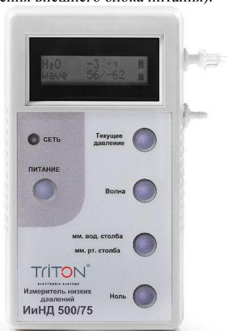
Рисунок 1 – Общий вид измерителя

Общий вид измерителя представлен на рисунке 1. Схема пломбировки от несанкционированного доступа представлена на рисунке 2 (показан верхний торец измерителя, оснащённый разъёмом подключения внешнего блока питания).