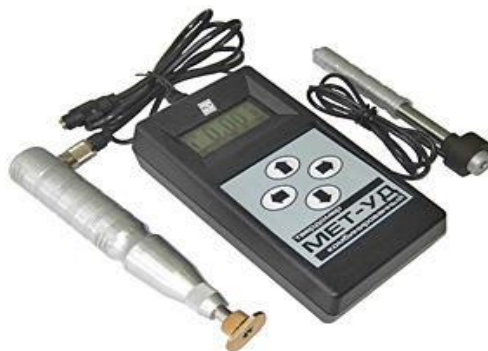
Рисунок 1 – Внешний вид твердомера МЕТ-УД

Внешний вид твердомера МЕТ-УД приведён на рисунке 1, схема пломбировки от несанкционированного доступа на рисунке 2.