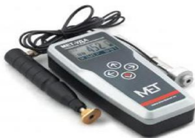
Рисунок 3 – Внешний вид твердомера МЕТ-УДА

Внешний вид твердомера МЕТ-УДА приведён на рисунке 3, схема пломбировки от несанкционированного доступа на рисунке 4.