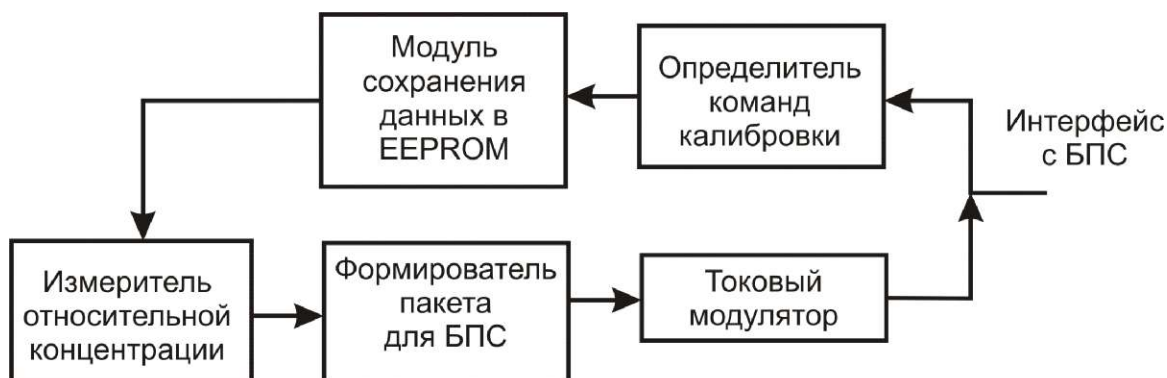
Рисунок 3 - Структура ПО блока датчика

Структура ПО блока датчика представлена на рисунке 3.