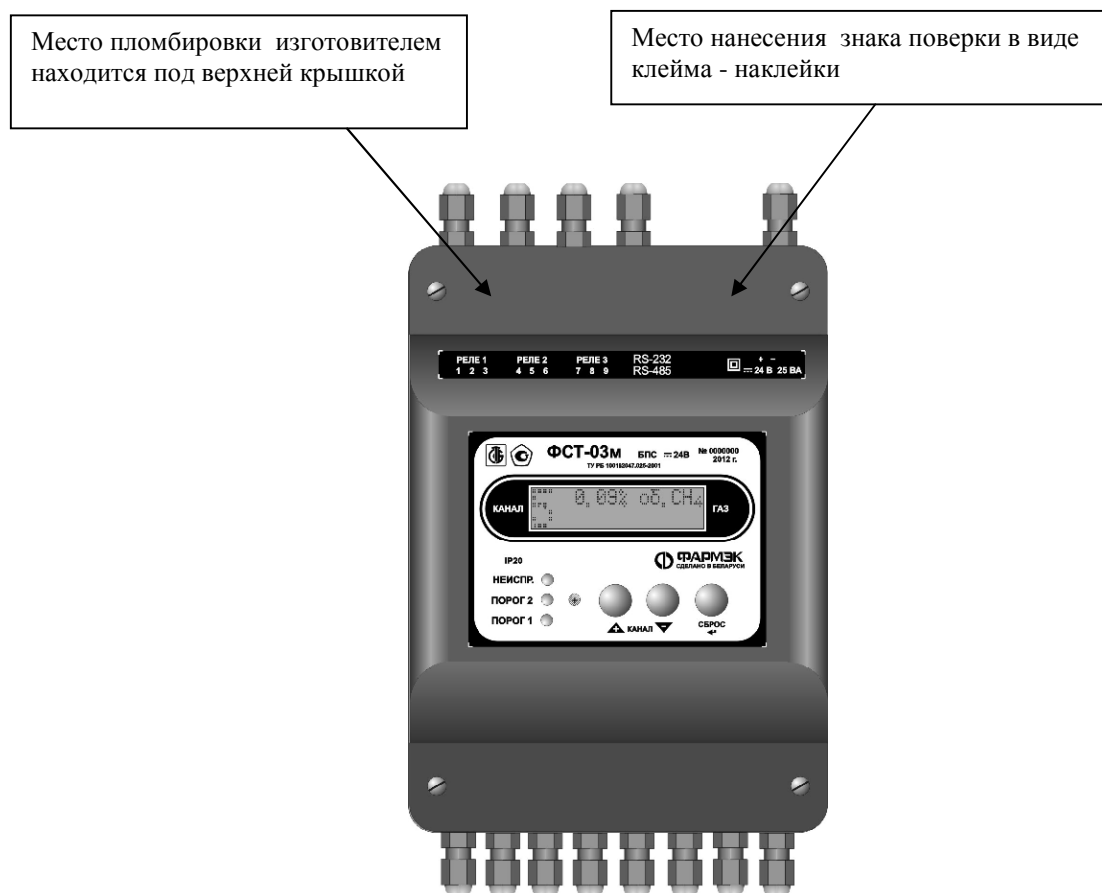
Рисунок 2 - Схема пломбировки для защиты от несанкционированного доступа и обозначение мест для нанесения оттисков клейм