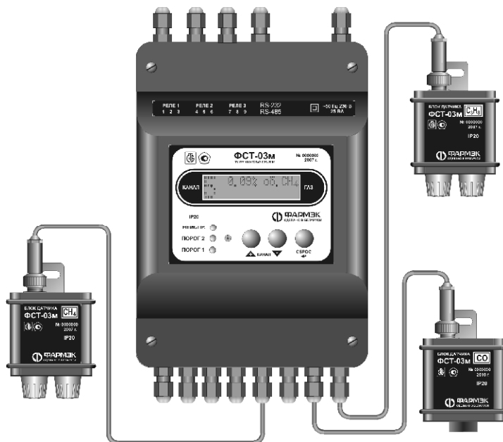
Рисунок 1 - Внешний вид газоанализатора ФСТ-03м с питанием от сети переменного тока с номинальным напряжением 230В, частотой 50 Гц

Внешний вид газоанализаторов приведен на рисунке 1, 1а.