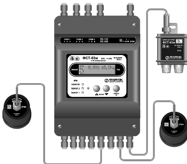
Рисунок 1 а - Внешний вид газоанализатора ФСТ-03м с питанием от источника постоянного напряжения с номинальным значением 24 В

Схема пломбировки для защиты от несанкционированного доступа и место для нанесения знака поверки в виде поверительного клейма-наклейки приведена на рисунке 2.