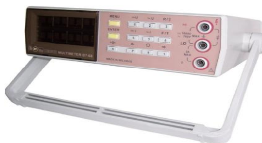
Рисунок 1 – Общий вид вольтметров

Общий вид вольтметров приведен на рисунке 1.