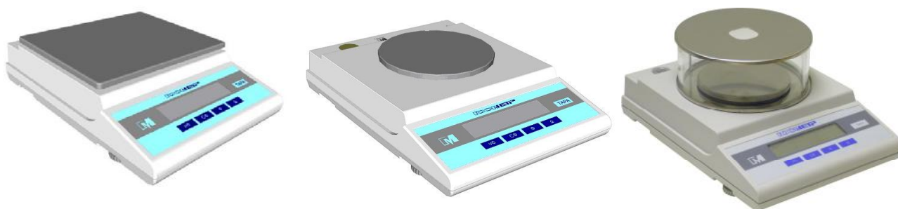
Рисунок 1 – Общий вид весов

Для защиты весов от несанкционированной настройки и вмешательства, которые могут привести к искажению результатов измерений, весы пломбируются поверх одного винта стяжки корпуса контрольной этикеткой изготовителя в соответствии со схемой, приведенной на рисунке 2.