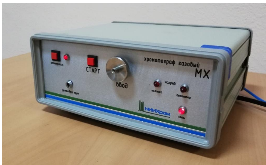
Рисунок 1 – Общий вид хроматографов газовых стационарных малогабаритных МХ модели МХК-1

Общий вид хроматографов газовых стационарных малогабаритных МХ модели МХК-1 представлен на рисунке 1. Схема пломбирования – на рисунке 2.