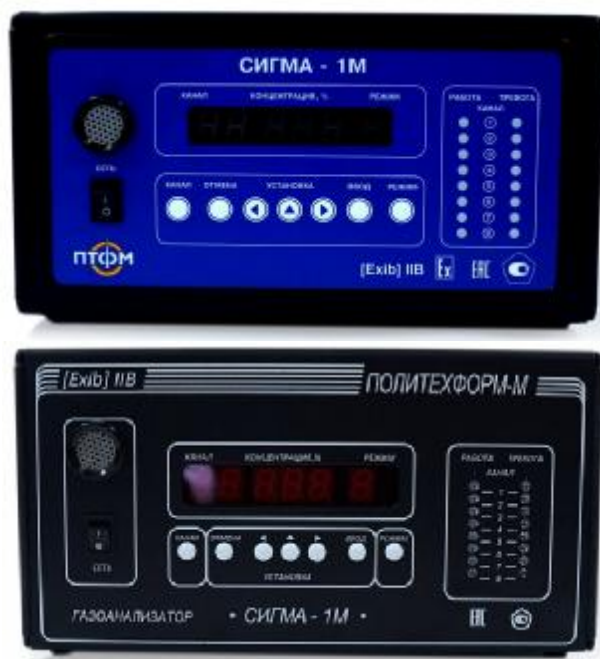
Рисунок 1 – Общий вид газоанализатора с двумя вариантами исполнения лицевой панели