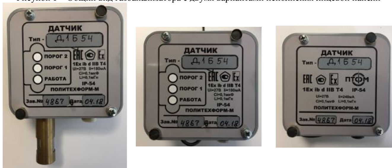
Рисунок 2 – Внешний вид датчиков (измерительных преобразователей)

Пломбированию подлежат следующие конструктивные элементы газоанализатора и датчиков: